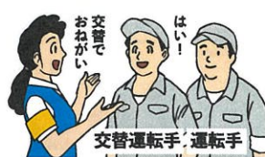
交替運転者の配置