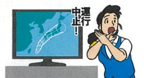
異常気象時等の措置