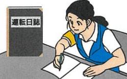
運転日誌の備付け