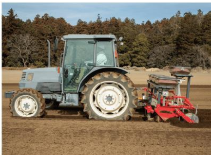
野菜用畝立同時局所施肥機